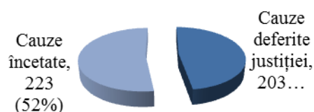
Figura nr. 2: Cauze penale finalizate în anul 2021